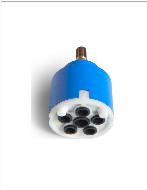
Immagine / Picture