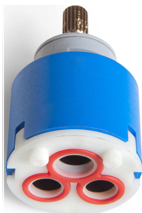
Immagine / Picture